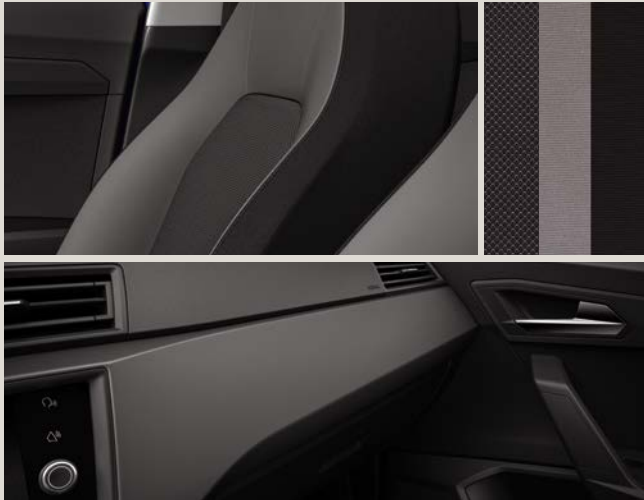
Estofos Tecido Orgad Cinzento / Ice Touch St