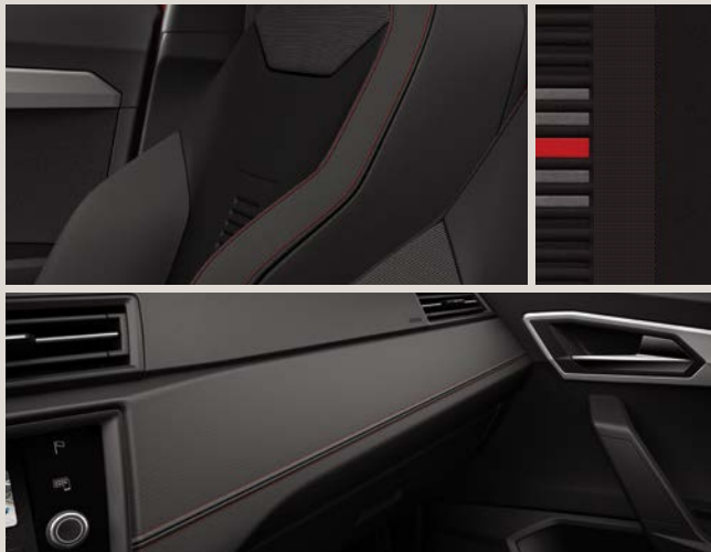
PAD Preto Gloss / Estofos com costura Vermelha FR

Reference R Style St Xcellence XE FR FR Opcional