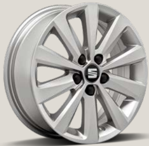
Enjoy R St XE