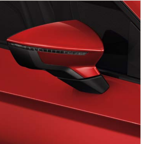
Vermelho Desire 2,3 R St XE FR