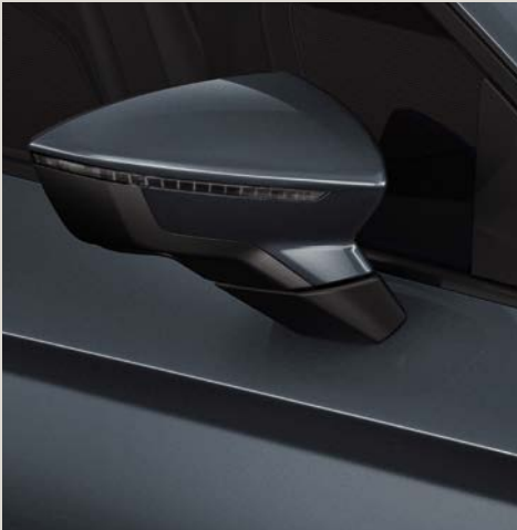
Cinzento Magnetic 2 R St XE FR