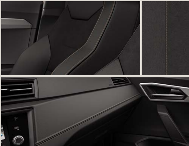
Estofos Dinamica em preto com costura Magenta Mystic XE