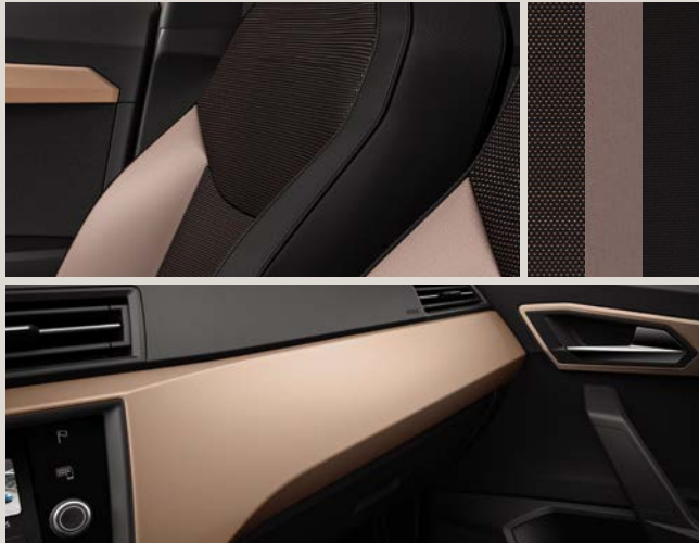
PAD Magenta Mystic / Estofos com costura Magenta Mystic XE