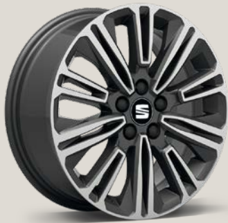
Design Maquinadas XE