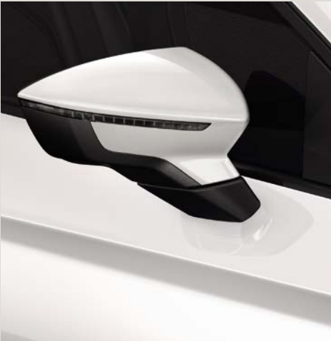
Branco Candy 1 R St XE FR