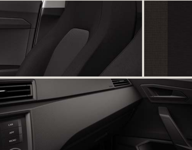
Estofos Tecido Acero / Preto Clip Titan R