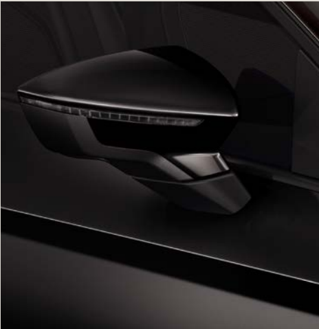
Preto Midnight 2 R St XE FR