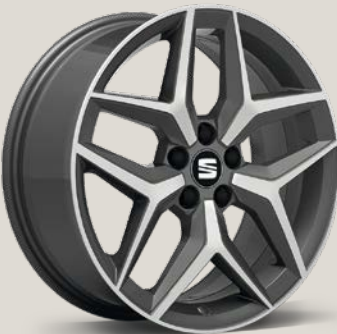
Dynamic Maquinadas XE