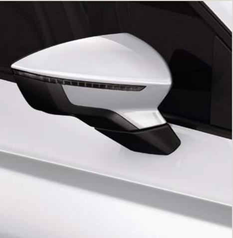
Branco Nevada 2 R St XE FR

Reference R Style St Xcellence XE FR FR Série ■ Opcional ■