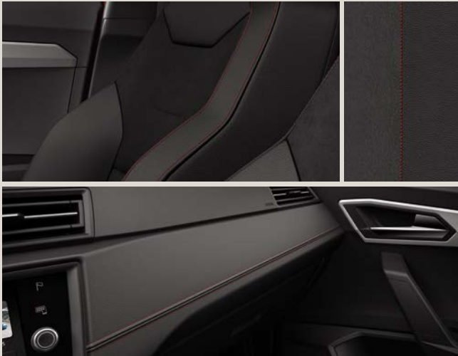
Estofos Dinamica com costura Vermelha FR