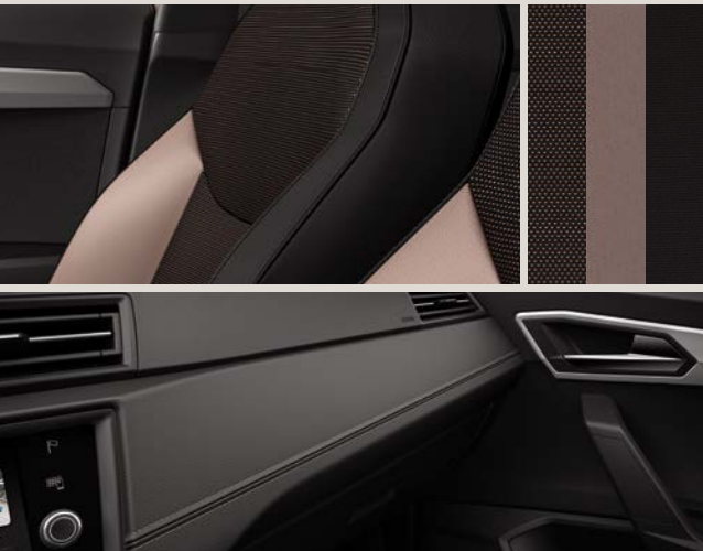
PAD Preto Gloss / Estofos com costura Magenta Mystic XE