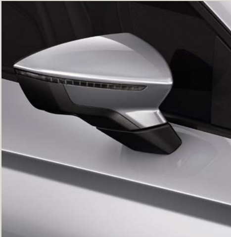
Prata Urban 2,4 R St XE FR