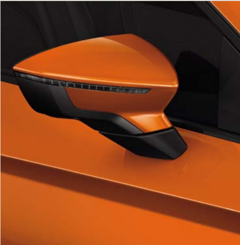
Laranja Eclipse 2,3 R St XE FR