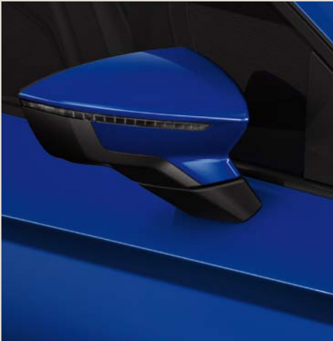
Azul Mystery 2,3 R St XE FR